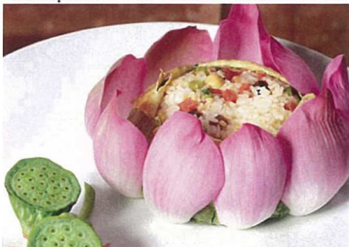
Cơm hấp lá sen.

https://havtravel.vn/mon-an-cung-dinh-hue/