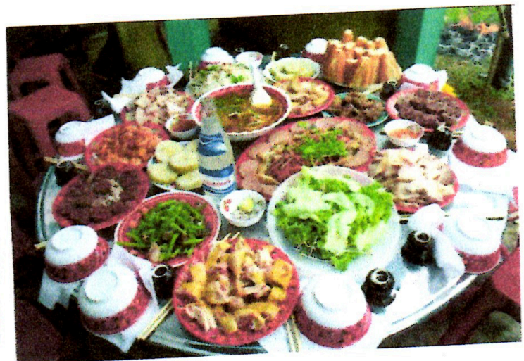
A huge table of foods is prepared to serve