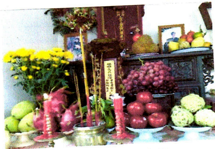
• Many kinds of fruits are placed on the altar