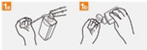
Apply a palmful of the product in a cupped hand, covering all surfaces.

1 Duration of the entire procedure: 20-30 seconds