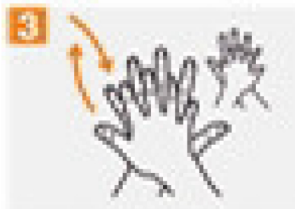
Right palm over left dorsum with interlaced fingers and vice versa.