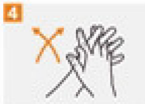
Palm to palm with fingers interlaced.