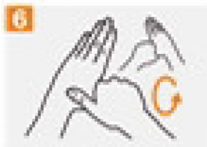
Rotational rubbing of left thumb clasped in right palm and vice versa.