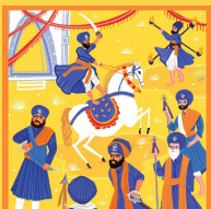
ਹੋਲਾ ਮਹੱਲਾ Hola Mohalla