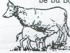
bê bú bò